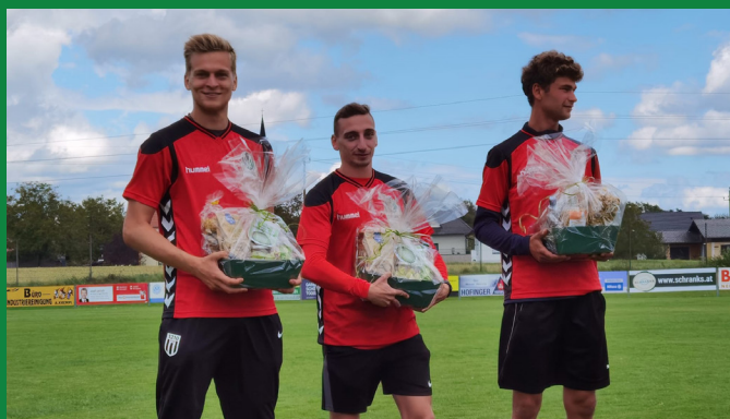
Das Trainerteam der Football School aus Wien

Neben vielen tollen sportlichen Erfolgen in den verschiedenen Altersgruppen war das Trainingscamp in Kooperation mit SV Josko Ried und der Football School aus 1210 Wien bestimmt unser Highlight in diesem Jahr. Dafür durften wir auch viel Lob über die Gemeindegrenzen hinaus ernten und wir fasste den Entschluss dieses Camp in den nächsten Jahren zu einem fixen Bestandteil in unserem Veranstaltungskalender werden zu lassen.