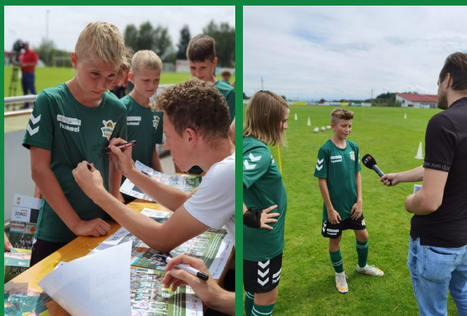
...natürlich war auch das Regionalfernsehen mit dabei!