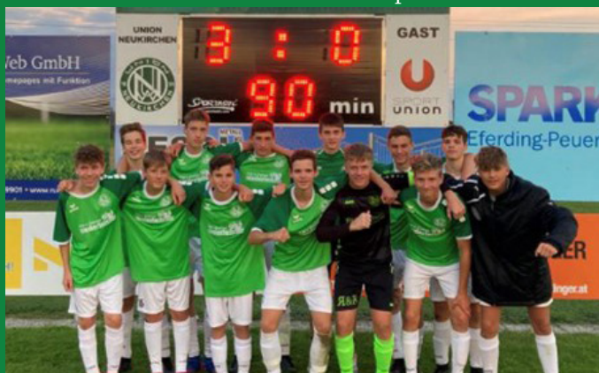
3:0 Derbysieg gegen SPG Natternbach/Willibald/ St. Aegidi