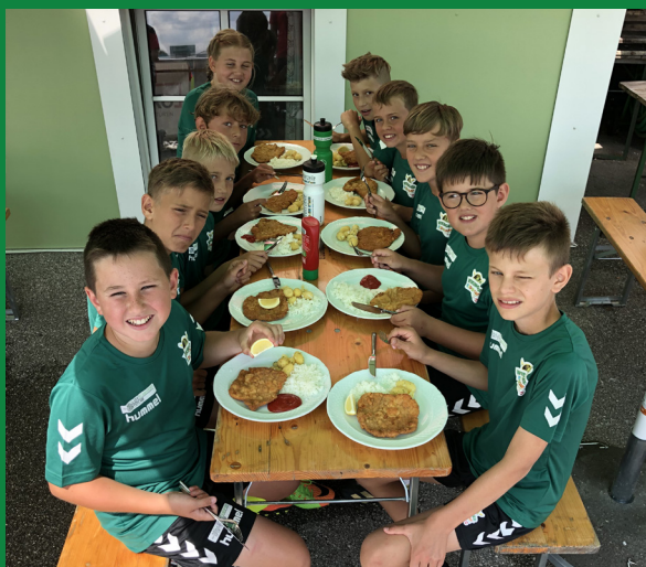
hochwertige Verpflegung durch GH Berghamer & GH Postwirt