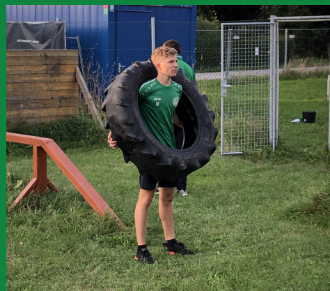
Teambuilding Event im „finisher Park“...